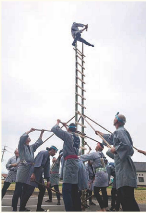
▲江戸時代の火消しに由来する伝統芸を披露する若鳶会

方、私自身も職業訓練指導員(とび科)として、現場指導や勉強会を通じて研さんを続けています」